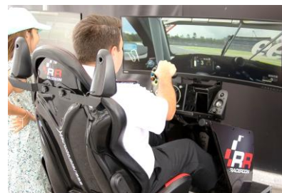
RACE ROOM SEATS